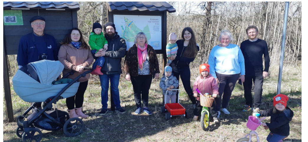
Kriimani küla rahvas infokaardi avamisel.