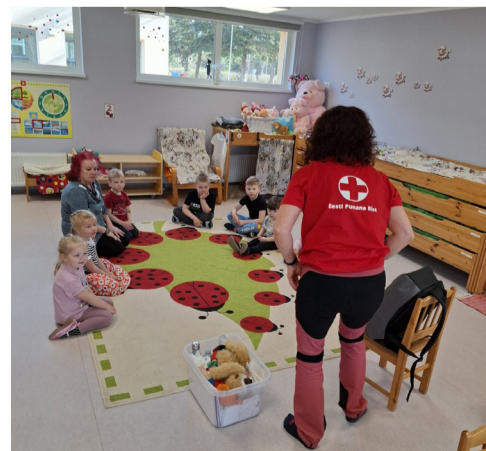
Esmaabikoolitus Võnnu lasteaias.