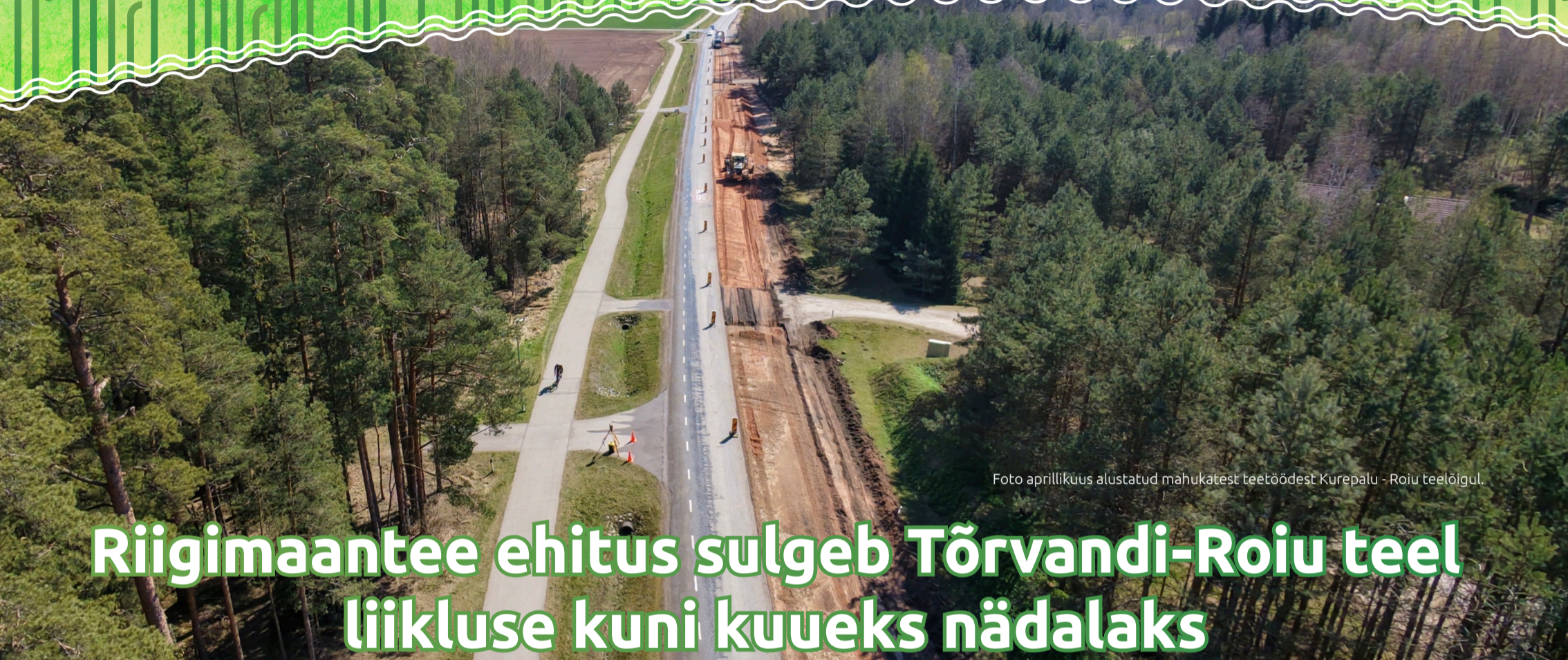
Foto aprillikuus alustatud mahukatest teetöödest Kurepalu -Roiu teelõigul.

LK 7 - Võnnu järvele paigaldati uued seadmed, et seljatada vetikate vohamine ja parandada vee tervist