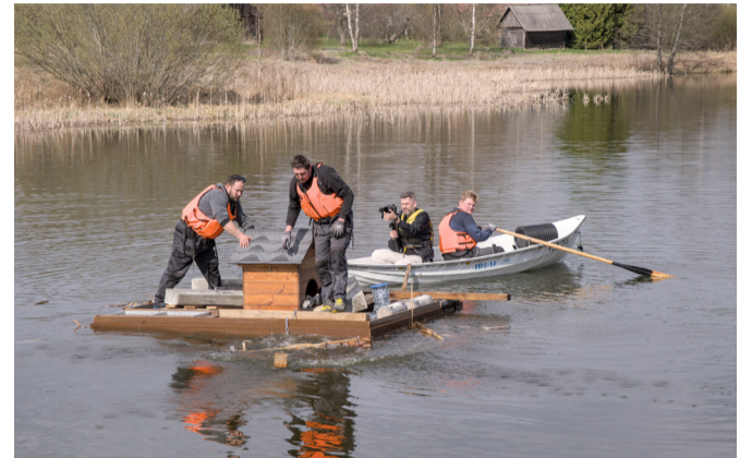
16. aprillil lasti Võnnu järve vette esimesed seadmed liigse fosfori püüdmiseks.