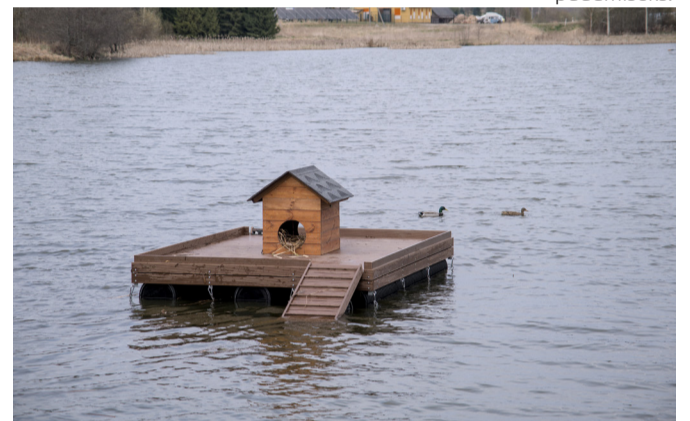
Kaval lahendus: visuaalselt linnumaja meenutav parv peidab endas tegelikult veealuseid filtermooduleid järvevee puhastamiseks.