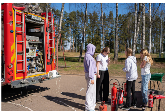
Päästepunkti tuli toime tulla näiteks seadme põlenguga.