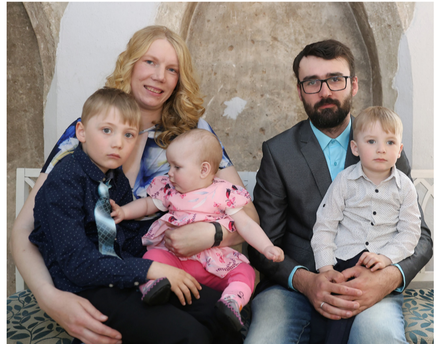
Tartumaa aasta ema Teele perre kuuluvad abikaasa ja kolm last.