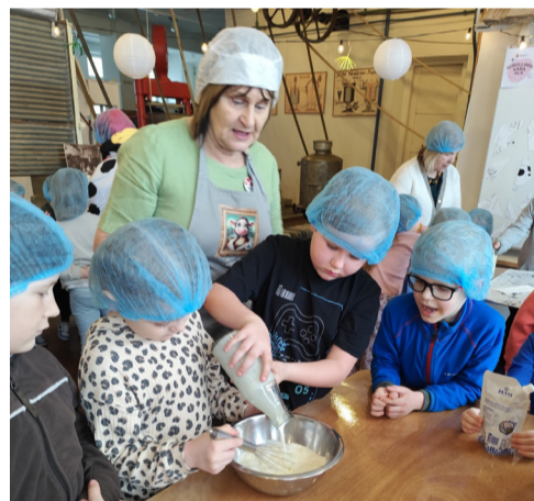
Piimandusmuuseumis õpiti jäätist valmistama.