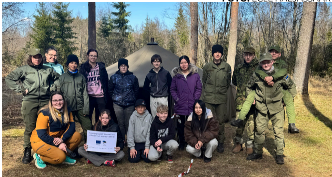
Noorte metsalaagri korraldamise taga olid noored ise.