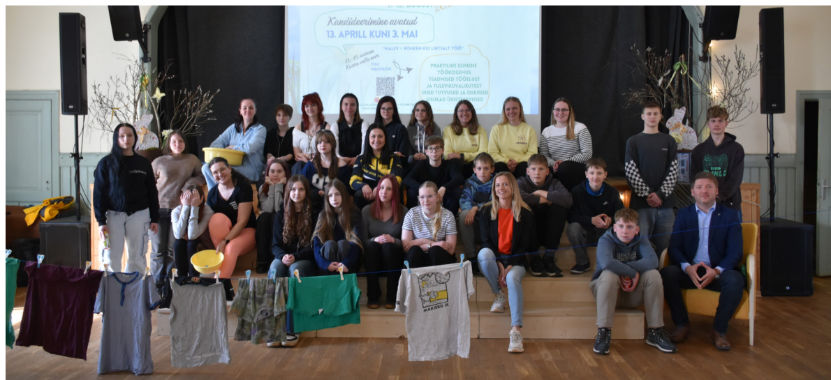
Tööelu häkaton koosnes praktilistest ülesannetest, maailmakohvikust ning "Elavast raamatukogust".