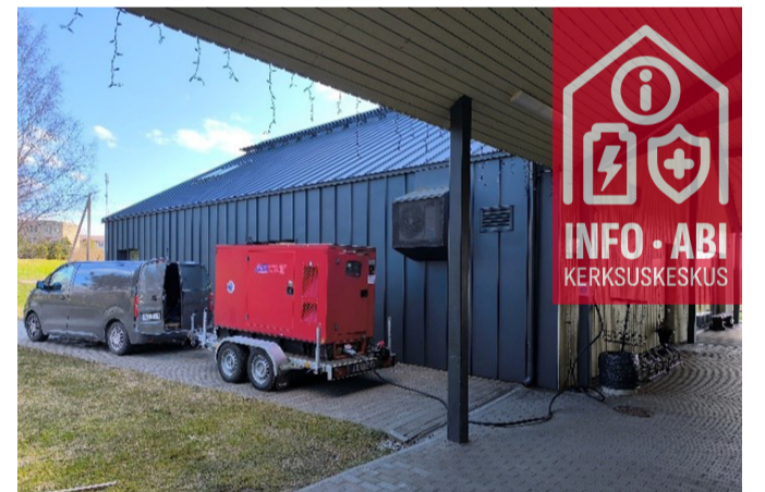
Keskuse juures olev generaator võimaldab elektrikatkestuse ajal elanikel laadida seadmeid, soojendada toitu ning kasutada interneti.