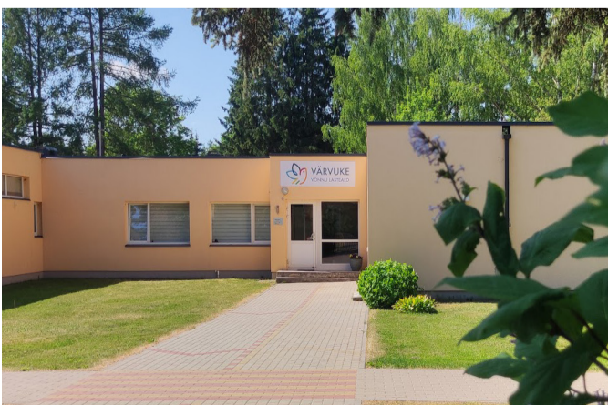
Võnnu lasteaed "Värvuke" ruumides jätkatakse uuenduskuuriga.