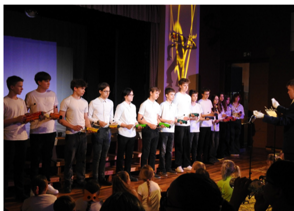
8. klassi õpilased esinesid pillimänguga.