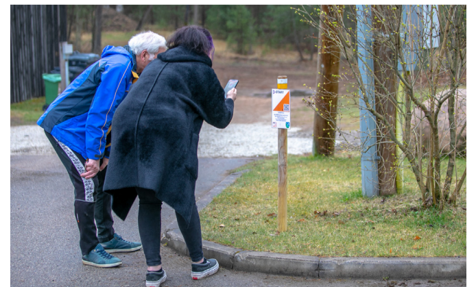
Kurepalu MOBO raja start asub Priiuse seltsimaja kõrval.