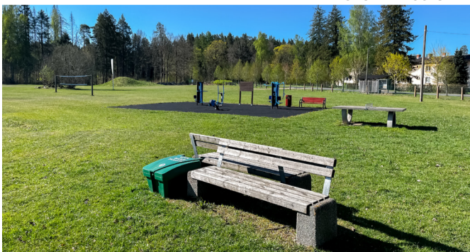
Pallikast Kaagvere staadioni mänguväljakul.