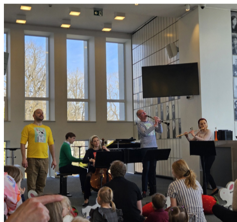
Kontsert "Vaikne hommikumusika" Vanemuises.