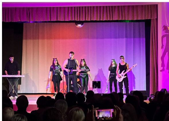
11. klass esitas hitti "I Was Made For Lovin' You".