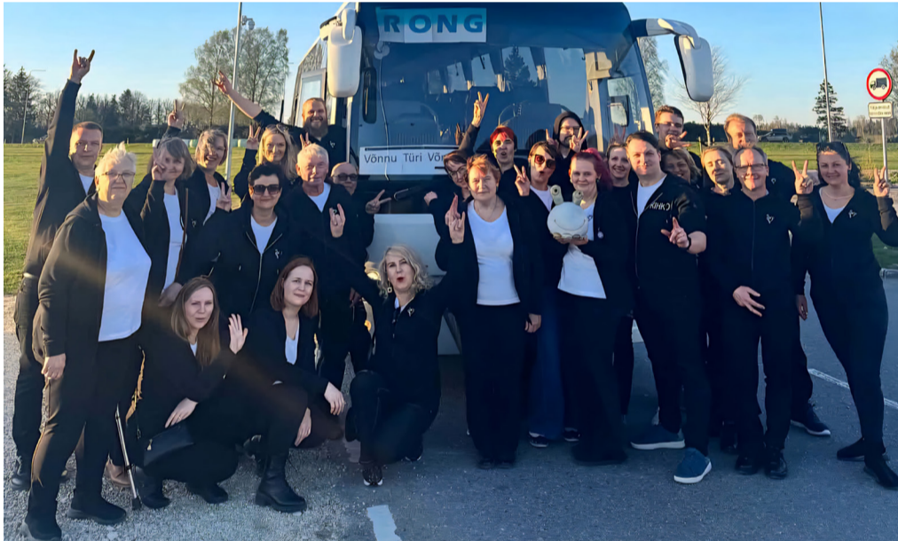
KIHKO kooripere sõidutav buss sai üheks päevaks nimeks hoopiski "Rong".