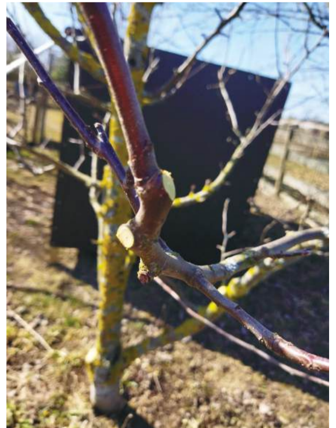
Korrektset lõigatud oks.