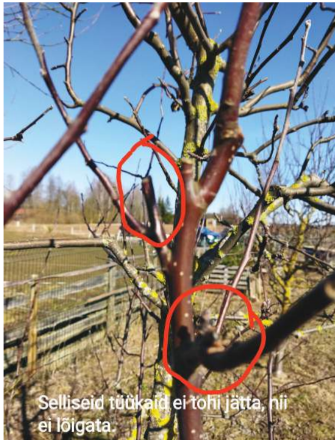
Ebakorrektset lõigatud oks.

Kui sul jääb oskusi puudu ja tunned, et on vaja ennast selles osas harida, siis kutsun sind viljapuude lõikamise koolitusele, mis toimub 15. märtsil siin samas meie Kastre vallas Haaslava külas.