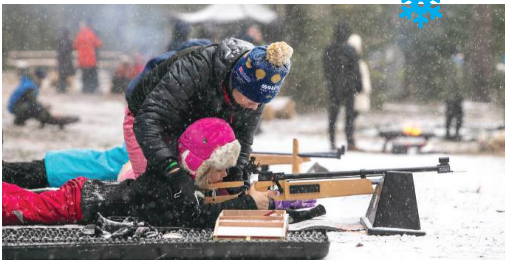
Märgi laskmine oli vilunud õpetajate käe all jõukohane kõigile.