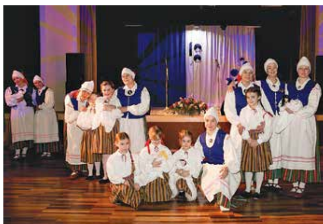
Erinevad põlvkonnad kontsert-aktusel.