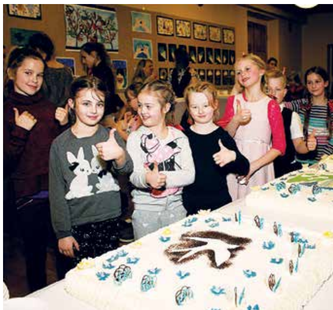
Juubelitordil.